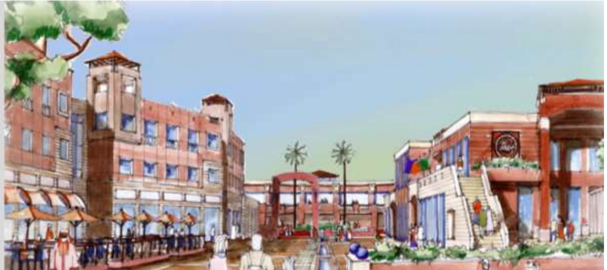
Nabq Commercial Mall.